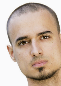
Írta: Diószegi Ádám www.jogaoktato.hu www.mandalajoga.hu